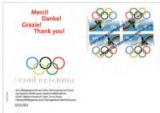
Abb. 4 / Fig. 4

La valise, toujours scellée, est rentrée en Suisse dans un vol Swissair. Nous, les supporters, avons essayé de nous consoler avec du champagne sur le chemin du retour. Au Centre technique de la Poste, Ostermundigenstrasse 91, on a surimprimé (surchargé) les blocs de quatre avec la mention «NON VALABLE» (fig. 4). C'était la fin d'un beau rêve.