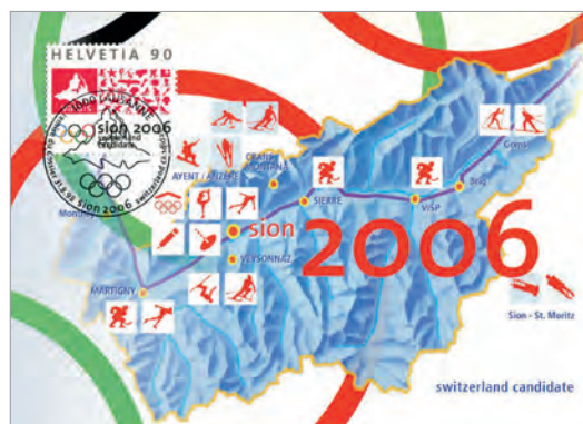
Abb. 2 / Fig. 2

tion, et Adolf Ogi! Ce que presque personne ne soupçonnait, c'est qu'un malheur se préparait.