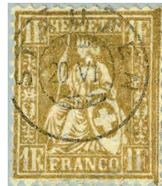
SBK 52 – Fälschung