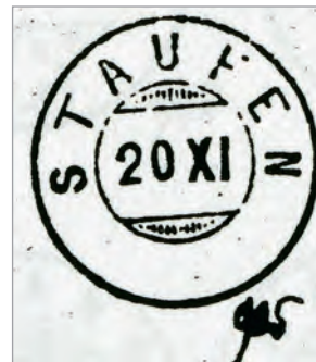
Güller-Handbuch: Zwergstempel «Staufen» Le cachet nain de Staufen

Die hier abgebildete Marke, eine «Sitzende Helvetia» 1 Franken golden auf Faserpapier mit Kontrollzeichen (SBK 52), ist mit einem klaren praktisch zentrischen Zwergstempel von Staufen gestempelt. Ein Prachtstück!