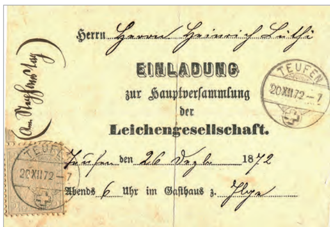
Abb. 1 / Fig. 1

Damals lebten im Appenzellerland viele auswärtige Gesellen. Allein in Trogen und Speicher waren es 1830 deren 150. Sie hatten kein Bürgerrecht. Bei Krankheit fehlte die finanzielle Unterstützung. Für die Begräbniskosten kam niemand auf. Schon 1827 wurden für die Auswärtigen «Hilfsanstalten» gegründet. Einheimische Kollegen von Firmen besorgten das Austragen der Verstorbenen und erwiesen durch das Beisein am Leichenbegräbnis ihre Anteilnahme (Abb. 1). Leichengesellschaften gab es nicht nur in den Kantonen Appenzell, sondern auch in Deutschland.