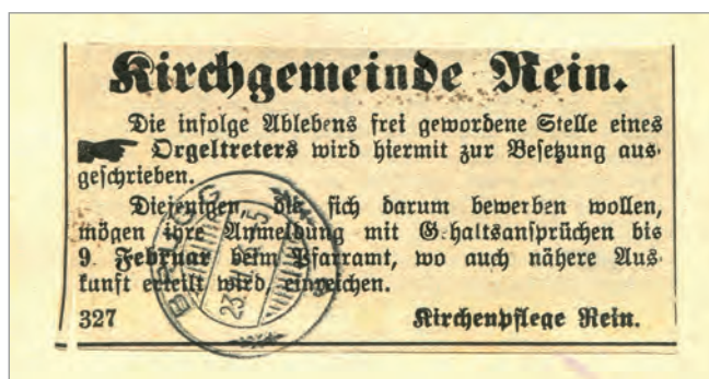
Abb. 2 / Fig. 2

Les compagnons venus de l'extérieur du canton devaient toutefois payer un droit d'entrée et une cotisation hebdomadaire. Tout le monde n'était pas admis. Celui qui était atteint de la gale ou qui avait une maladie de la peau en était exclu, tout comme celui qui souffrait de la «maladie du plaisir» (la syphilis, maladie vénérienne), qui s'adonnait à la glotonnerie ou qui était impliqué dans des combats à mains nues. Il existait aussi toute une série de motifs d'exclusion moraux. A titre d'exemple, ce fut le cas de l'Association funéraire de Speicher, fondée en 1854, qui décida, à l'occasion d'une modification ultérieure de ses statuts, que les porteurs de corps de l'association ne devaient plus enterrer les femmes divorcées des membres.