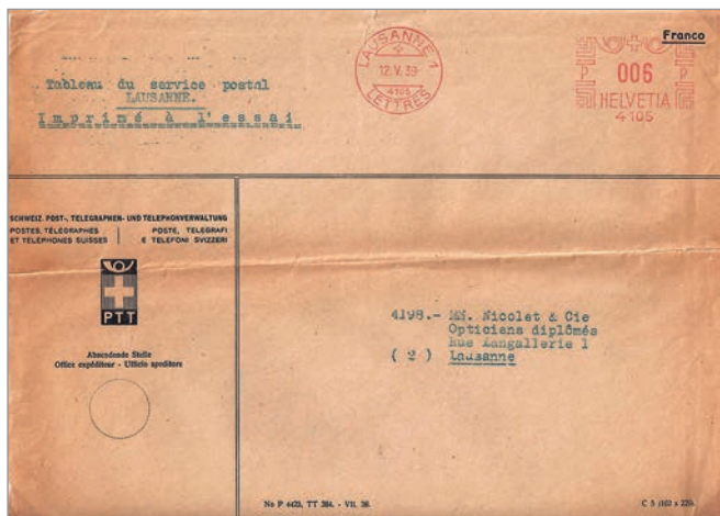
Fig. 25. Imprimé à l'essai du service national à destination de Lausanne. Cachet Lausanne, 12.5.1939. Imprimé à l'essai < 50 g avec taxe réduite pour envoi en nombre = 6 cts [1.4.1935–31.10.1967]. EMA N° 4105 avec couronne type D éloignée, pos. 3. Peu d'exemplaires entiers connus avec cette valeur.