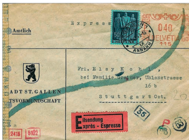
Fig. 28. Lettre du service international expédiée par express à destination de l'Allemagne. Cachet St. Gallen 15.11.1943. Nombreuses censures allemandes et test chimique. Lettre ≤ 20 g = 30 cts [1.10.1924 – 29.2.1948] + taxe par express = 60 cts [1.10.1924–29.2.1948]. EMA N° 115 sans couronne, pos. 3.