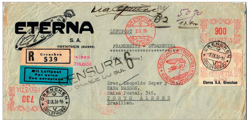
Fig. 31. Lettre (50 g) du service international envoyée en recommandé à destination du Brésil. Cachet Grenchen, 2.9.1936. Le pli a voyagé par zeppelin (DHL, b = Friedrichshafen). EMA N° 4345 avec couronne type D (2 × dont une inversée) + une étiquette. Pos. 3. Tampon de marque de censure «Censura 6 / Rio grande do Sul». Port de Fr. 17.-: lettre pour l'étranger de 41–60 g (3 e échelon de poids) = 30 cts/20 g + 2 × 20 cts/20 g = 70 cts (1.10.1924–29.2.1948) + taxe poste aérienne 10 × 160 cts/5 g (10 e échelon de poids) = Fr. 16.- (1932–31.3.1935) + taxe de recommandé = 30 cts (1.7.1930–29.2.1948).