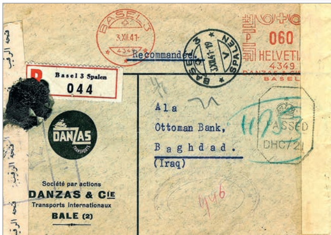
Fig. 29. Lettre du service international expédiée en recommandé à destination de l'Irak. Cachet Bâle, 3.12.1941. Plusieurs censures anglaise et irakienne. Lettre de ≤ 20 g = 30 cts [1.10.1924–28.2.1948] + taxe de recommandé = 30 cts [1.7.1930–29.2.1948]. EMA N° 4349y avec couronne type D, pos. 3.