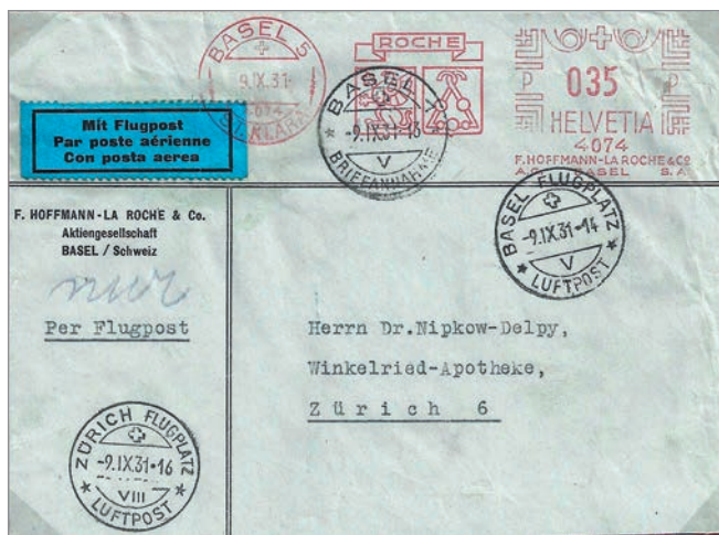
Fig. 27. Lettre (< 250 g) du service national envoyée par avion à destination de Zurich. Cachet Basel, 9.9.1931. Mention dactylographiée «Per Flugpost» + vignette bleue (n° 532/4). Port de 35 cts: lettre ≤ 250 g du service national = 20 cts (1.1.1921–31.10.1967) + taxe de poste aérienne = 15 cts (1.7.1925–31.12.1934). EMA N° 4074y avec couronne type D éloignée, pos. 3½. Pub B1.

Compte tenu de la petitesse de la Suisse et de l'efficacité du réseau ferroviaire, le courrier commercial transmis par avion dans le pays était plutôt rare.