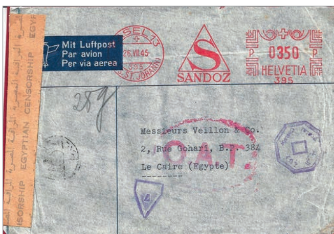
Fig. 30. Lettre (28 g) du service international envoyée par avion à destination de l'Egypte. Cachet Basel, 26.7.1945. Marque «O.A.T.» ovale et diverses censures égyptiennes. Port de 350 cts: lettre pour l'étranger de 21–40 g (2 e échelon de poids) = 50 cts (30 + 20 cts/20 g: 1.10.1924–29.02.1948) + taxe poste aérienne (6 × 50 cts/5g: 1.11.1943–1946) = 300 cts. EMA N° 395 avec couronne type D éloignée, pos. 4. Les EMA de type 2, avec marque «O.A.T.», sont rares.