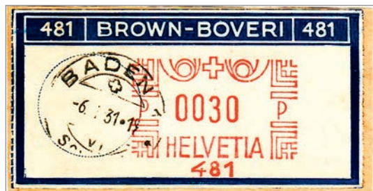
Fig. 23. Ex. d'étiquettes gommées en rouleau à dentelure verticale, imprimées à l'avance (en haut) et ex. d'étiquettes autocollantes à percement vertical en ligne; impression en bande (en bas).