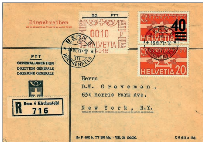
Fig. 19. Machine n° 4016 de la DGP.

La Direction Générale des PTT a utilisé une machine (n° 4016 – figure 19) durant de nombreuses années. Le cliché a été livré le 24.2.1930 et la période d'utilisation connue est du 22.8.1930 au 2.8.1957.