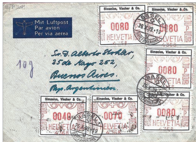
Fig. 24. Cachet Bâle, 26.10.1939. Six étiquettes gommées sur une lettre (10 g) du service international envoyée par avion à destination de l'Argentine. EMA N° 4368, pos. 4. Port de 430 cts: lettre pour l'étranger ≤ 20 g (1 er échelon de poids) = 30 cts/20 g (1.10.1924 –29.2.1948) + taxe poste aérienne = 2 x 200 cts/5 g (1.10.1937–17.12.1939).