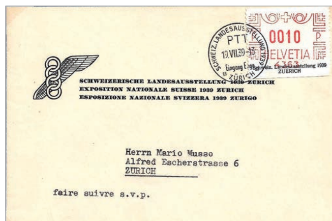
Fig. 20. Machine n° 4363 pour Schweizerische Landesausstellung 1939 Zürich. Le cliché a été livré le 28.9.1936 et la période d'utilisation connue à ce jour va du 5.10.1937 au 3.8.1940.

A partir de 1936 est apparue une machine (N° 4363), utilisée par l'administration de l'exposition nationale (figure 20). On peut trouver des EMA avec une couronne de type D. L'oblitération avec le cachet spécial de l'exposition est également un document apprécié des collectionneurs.