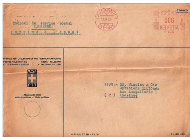
Fig. 25. Imprimé à l'essai du service national à destination de Lausanne. Cachet Lausanne, 12.5.1939. Imprimé à l'essai < 50 g avec taxe réduite pour envoi en nombre = 6 cts [1.4.1935 –31.10.1967]. EMA N° 4105 avec couronne type D éloignée, pos. 3. Peu d'exemplaires entiers connus avec cette valeur.