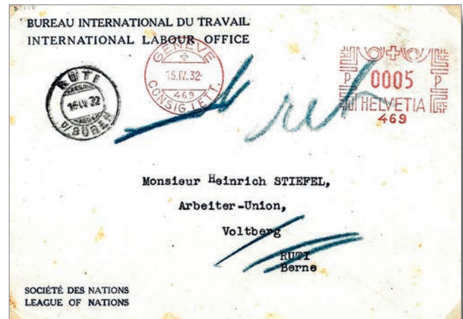
Fig. 21. Machine n° 469 du Bureau International du Travail à Genève.

affranchir Hasler F22 (figure 21). LA DGP envoya le cliché le 19.8.1930, et l'emploi attesté va du 31.10.1930 jusqu'au milieu de 1952. Auparavant, du 17.9.1926 au 30.10.1930, ce fut une machine de type 1B (clichés ovales) également avec le N° 469.