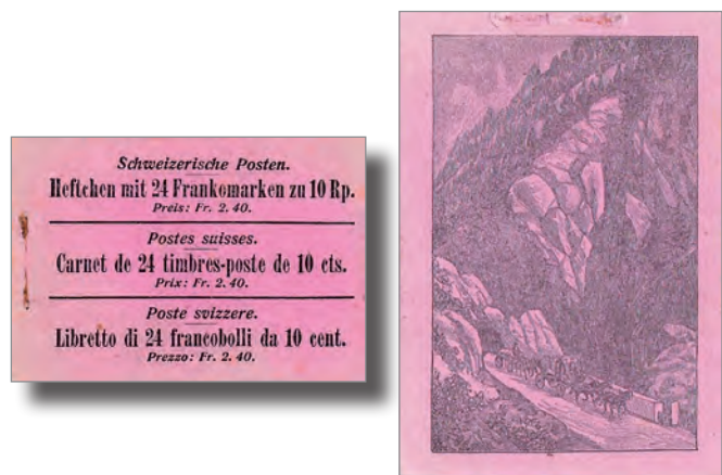
Fig. 1 et 2. Les feuillets de garde qui ont servi pour l'assemblage des carnets 2 et 4.

Dernièrement, il nous a été donné de trouver une variété fort intéressante sur un timbre issu du carnet n° 2 (fig. 1 et 2). Cette découverte corrobore la thèse décrite par l'expert Kurt Trüssel en 1984 puis en 1989 (fig. 3) dans le «Journal philatélique suisse» (cf. SBZ/JPhS 6/1984 et 9/1989).