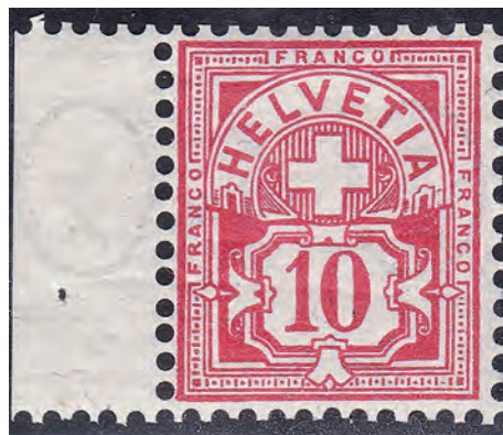
Fig. 4. La variété découverte, MC déplacée.

Cette variété provient du fait que la marque de contrôle (MC) a été fortement déplacée vers la droite. Au lieu d'apparaître par-