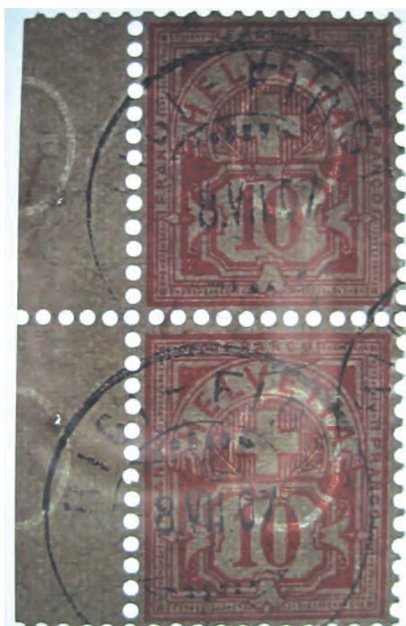
Fig. 5 et 6. Les exemples fournis par Pierre Guinand, MC positionnée normalement.

portant cette variété (cf. fig. 5 et 6). Pierre Guinand relève que c'est la première fois jusqu'ici qu'il a constaté cette variété sur les timbres issus du carnet n° 2, soit le timbre de 10 cts portant le n° 61B.