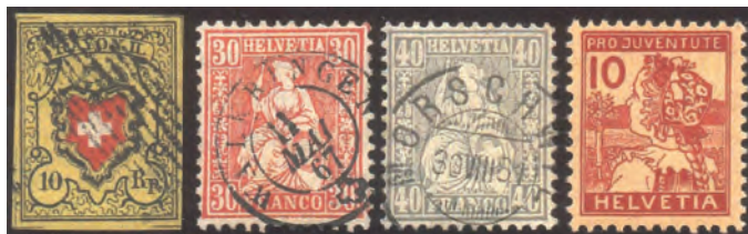
Les quatre jolis timbres choisis pour illustrer cette collection.

Les timbres choisis pour cette illustration sont plaisants, les oblitérés sont propres, le Rayon II a de belles marges, la Lucernoise est certainement sans charnière, comme l'indiquent les deux étoiles. Un choix judicieux des images donc, pour donner envie d'examiner, puis d'acquérir cette collection.