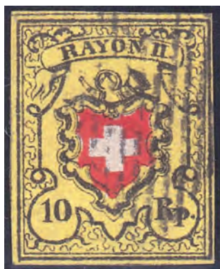
Un type 30 authentique.