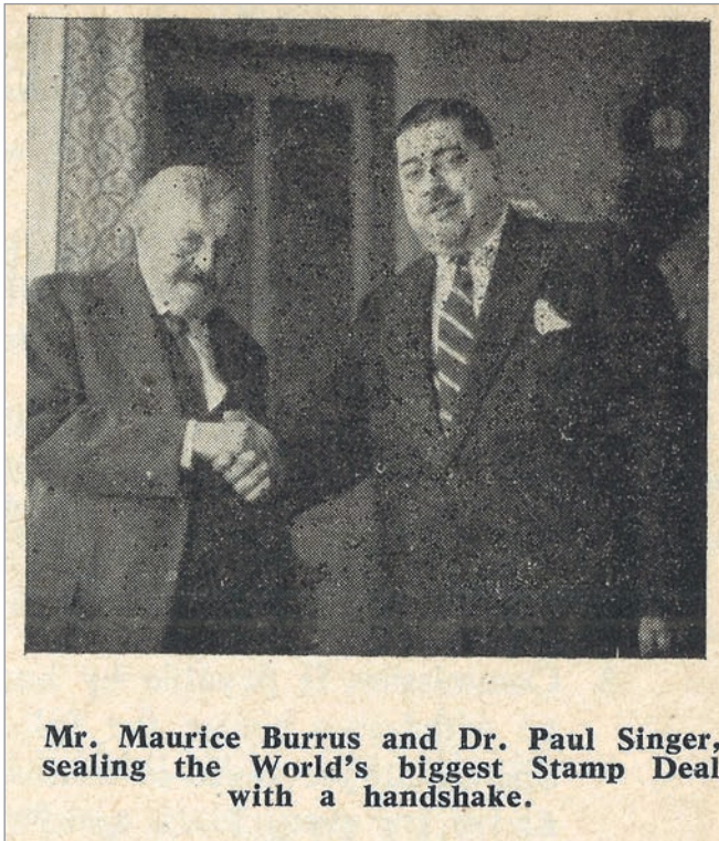
Die gleiche Abbildung zum erfolgreichen Verkauf erschien im 101. Auktionskatalog der Firma Shanahan.