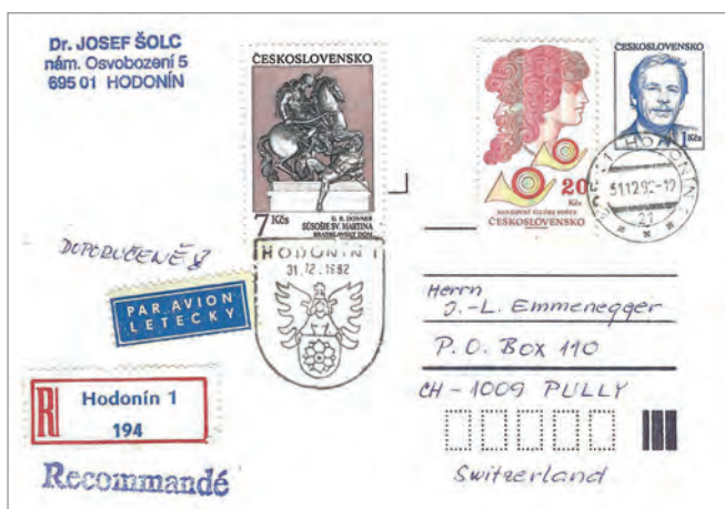
Enveloppe recommandée expédiée le 31.12.1992 de Hodonin, affranchie avec des timbres de «Ceskoslovensko». La date est le dernier jour de l'existence de cet Etat.

Das Ziel dieses Artikels ist jedoch nicht die politische oder postalische Geschichte der Tschechoslowakei seit 1918 nachzuzeichnen, denn dafür benötigte man ein ganzes Buch. Unser Ziel ist hier vielmehr, auf ein unglaubliches Ereignis aus dem Jahre 1993 zurückzukommen, also vor 25 Jahren: die Trennung der «alten» Tschechoslowakei in zwei neue, unabhängige Staaten, in einem demokratischen Verfahren. Die Namen der beiden Staaten sind die Tschechische Republik und die Slowakei.