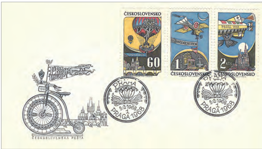
Envelope spéciale de la PRAGA 1968, avec les trois timbres spéciaux émis pour cette exposition philatélique à Prague.

Sonderbrief der PRAGA 1968 mit den drei Sondermarken, die für diese Philatelieausstellung in Prag herausgegeben wurden.