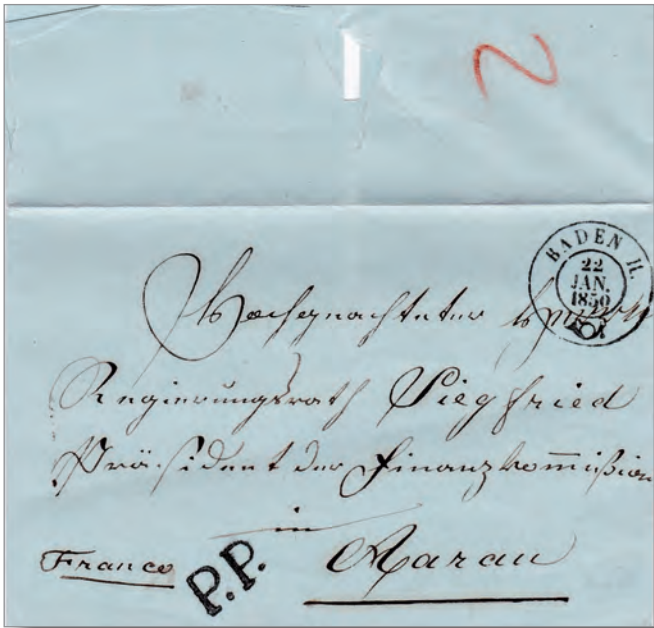
Illustration 4. Pli de Baden (22 janvier 1850) à Aarau adressé en PP port au verso tracé en rouge 2 Kreuzers, soit 5 cts pour un pli d'un demi-loth pour le 1 er rayon.