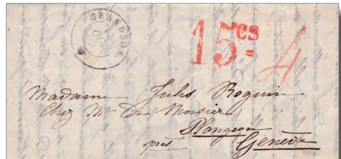
Illustration 2. Pli de Grandson à Genève, 1 er échelon de poids \leq \frac{1}{2} Loth et 2 e rayon 48 à 120 km. Ce pli a été envoyé le 10 octobre 1850. Il a été taxé à Grandson en ancienne monnaie soit 4 kreuzers, à Genève ce pli a été taxé en monnaie de Genève soit 15 cts. (1 kreuzer = 2,5 cts, 4 kreuzers = 10 cts en 1850. Le franc de Genève valait 1,43 franc suisse de 1850, soit 10 cts x 1.43 = 14,3 cts qui ont été arrondis à 15 cts).

enfin acceptée par le Parlement: «Cinq grammes d'argent, au titre de neuf dixièmes d'argent fin, constituent l'unité monétaire suisse, et portent le nom de franc.»*