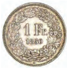
Illustration 1. Revers d'une pièce d'un franc frappée en 1850 avec le poinçon «A», marque de l'atelier monétaire de Paris.

Une première mesure fut de créer une monnaie unique, ce qui fut réalisé en 1848 lorsque la Confédération s'attribua la régalie des monnaies. Le franc est divisé dès lors en 100 centimes. Les Alémaniques maintinrent le terme Rappen, dernier vestige des anciennes monnaies. Les premières pièces (5, 2, 1 et ½ franc) furent frappées en 1850 à Paris.