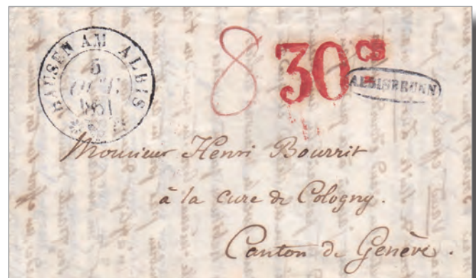
Illustration 3. Pli expédié d'Albisbrunn, puis Hausen am Albis (ZH) 5 OCT. 1851, la lettre est encore taxée au départ dans l'ancienne monnaie cantonale, c.-à-d. en kreuzers. A son arrivée à Genève la poste taxe correctement ce pli provenant du 4 e rayon tarifaire, 1 er échelon de poids \leq \frac{1}{2} Loth, soit 30 cts de Genève payés par le destinataire. 1 kreuzer = 2,5 cts, 8 kreuzers = 20 cts (cf. légende de l'illustration 2).

En dehors de ces exceptions genevoises, durant les années 1850 et 1851, le courrier non affranchi était taxé en ancienne monnaie (kreuzer). L'habitude de ne pas affranchir le courrier a été difficilement abandonnée. Il faut attendre le 1 er juillet 1862 pour qu'enfin la Poste fédérale surtaxe le courrier non affranchi, ceci afin de favoriser l'usage des timbres et de rationaliser le travail de l'Administration postale. ■